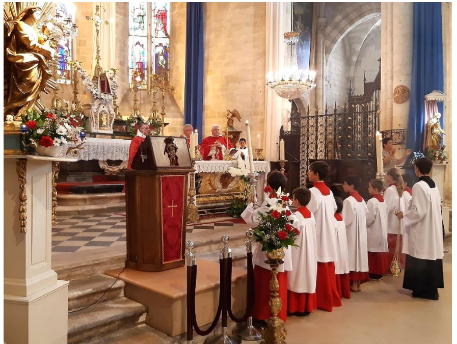
La Sainte Communion à Corps et au Sang du Christ