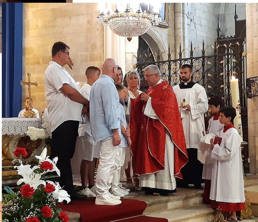
Le Saint chrême